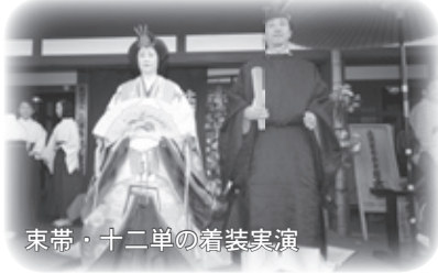
東帯・十二単の着装実演