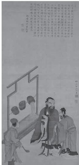
かぶらぎばいけい 鏑木梅溪画・関其寧賛 「孔子図」