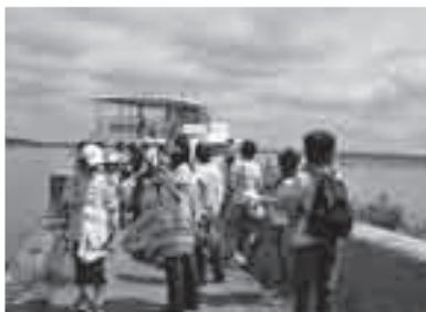
親子史跡めぐり(遊覧船)