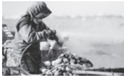
レンコンの収穫風景

市内でとれた農産物を使っていろいろ工夫をしていることをアピールした。また、フードアクションニッポンとして、地元でとれた農産物を紹介し、消費しているということが分かった。