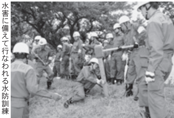
水害に備えて行なわれる水防訓練

月末に地域の消防団で堤防の点検を行っているそうです。また、各家庭には、防災避難地図が配られており、災害がおこった時の避難場所が記してあるとのことでした。各小・中学校には、30か所の防災倉庫があり、その中には、トイレや約5万人分の非常食、水があるそうです。次の質問、私たちに協力出来ることはありますか」に対して、「自宅に非常食や水を用意し、避難場所を家族で話し合っておくと良いでしょう」と回答してくれました。