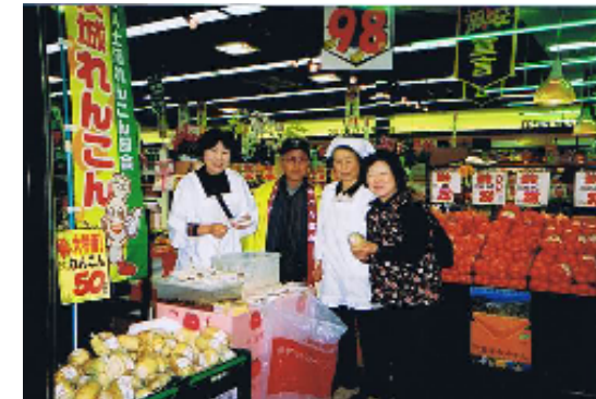
れんこんフェスティバルの様子