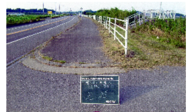
市道の草刈り実施後