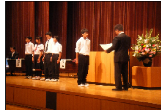
下水道展（左）及び下水道コンクール表彰式（右）