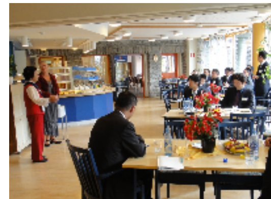
平成22年度の海外派遣研修時の様子