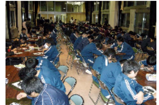
宿泊体験学習の様子