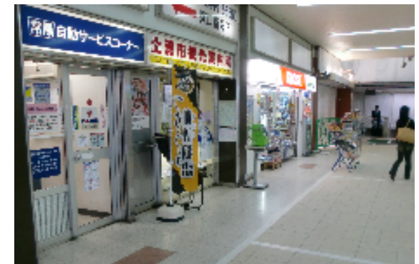
土浦駅観光案内所