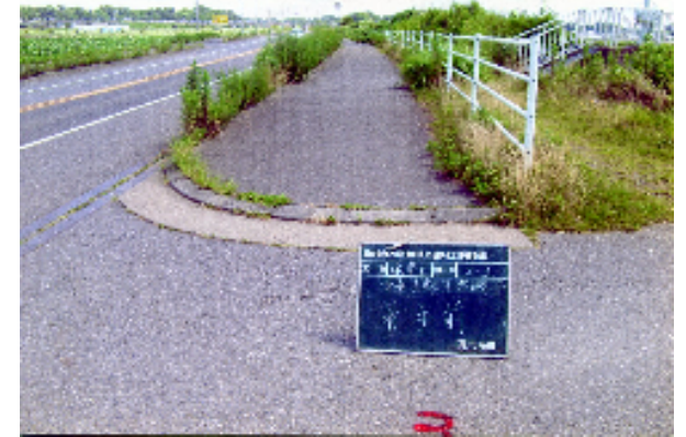
市道の草刈り実施前