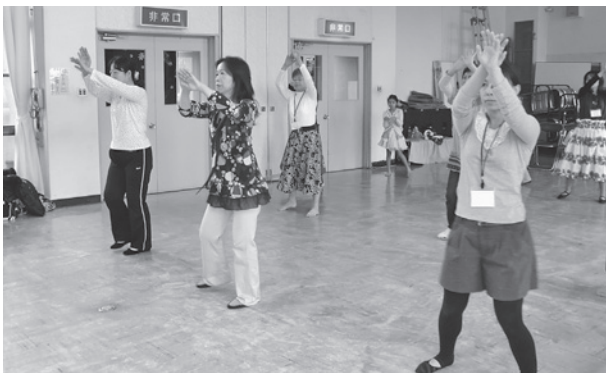
初めてのフラダンス