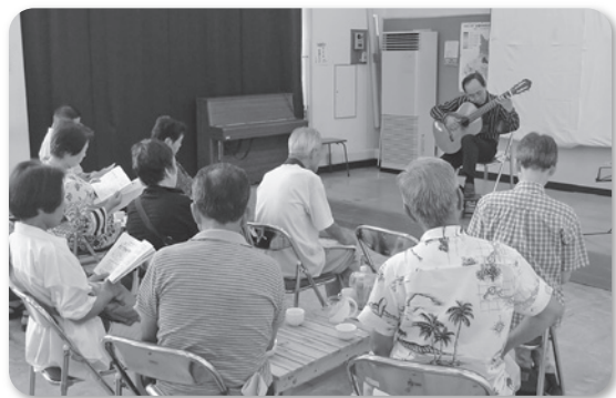
文化茶話会：夢のマジックショーと ギターコンサート (文化広報部)