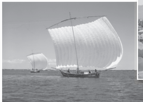
(沖宿 折本正榮氏撮影)