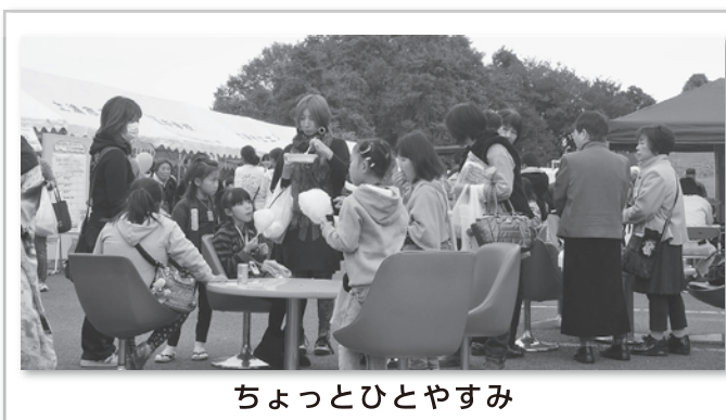
ちょっとひとやすみ