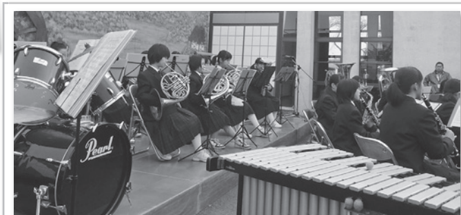
♪ 五中吹奏楽部 ♪