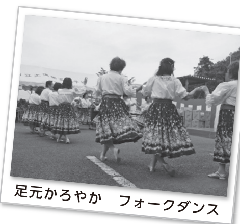
足元かるやか フォークダンス