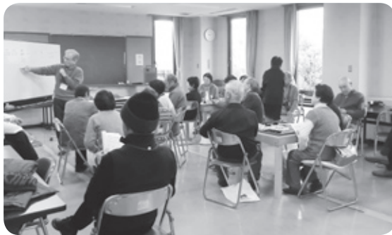
頭の体操マージャン

平成24年度に開催された都和地区ふれあいコンサートでは、合唱、ジャズ、津軽三味線と若者の汗が飛び散り、エネルギーを肌で感じ、たくさん感動をいただきました。ありがとうございました。