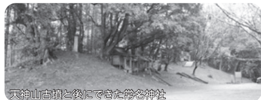
天神山古墳と後にできた常名神社