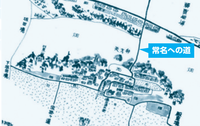
江戸時代－常名村絵図 1865年(慶応元年)