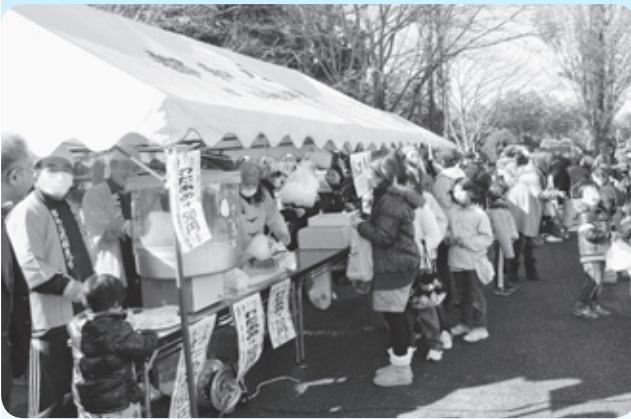
好評の模擬店 (わたあめ等)

さらに、土浦消防署の協力により、子どもたちに「はしご車の搭乗」や「煙」体験コーナーを設けたところ順番待ちとなり大好評でありました。防災に対する意識づくりが図られました。