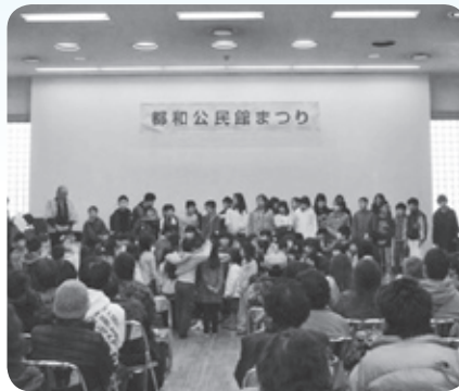
ポイ捨て防止ポスター表彰式