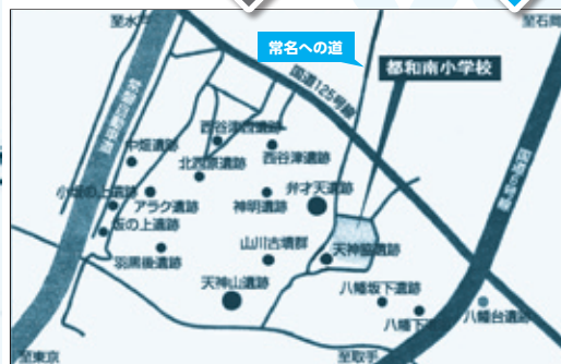
古墳時代(700年頃以前)－常名台の遺跡群