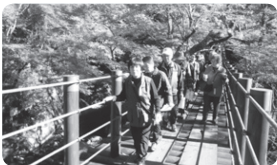
花貫渓谷の散策会

25年度もこうした事業を行ってまいりたいと思いますので奮って参加下さい。参加して楽しみましょう。