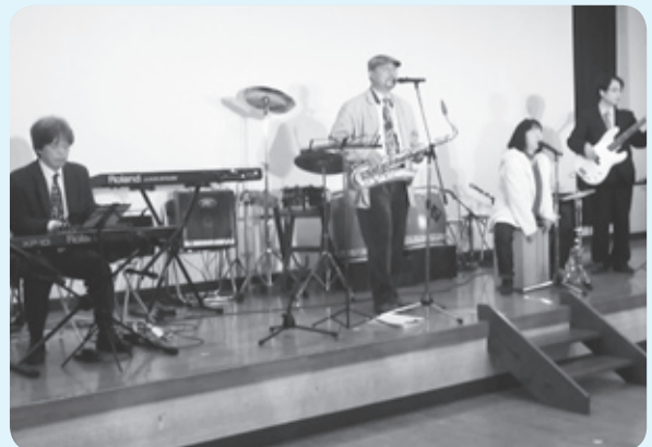
ジャズやポップス演奏