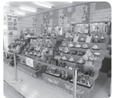
賑わいの雛飾り・吊し雛

「つわの風」は、都和公民館を取り巻く市民の方々の喜怒哀楽をお伝えする情報紙です。都和地区の活動や出来事をお知らせしたいと思います。皆様のご意見や新しいニュースがありましたらお聞かせ下さい。ご協力をお願いいたします。