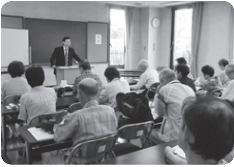
知っておきたい相続税・贈与税