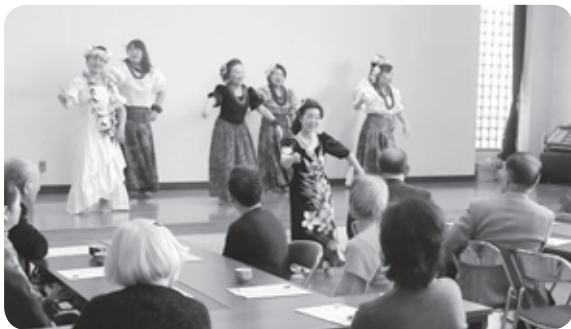
ひとり暮らし交流会

その都和中地区の相談窓口が都和公民館にある「社会福祉協議会都和支部」です。地区公民館は、地域密着型