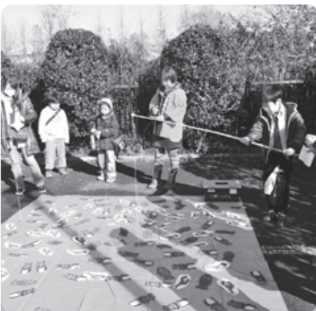
さかなつれたかな?