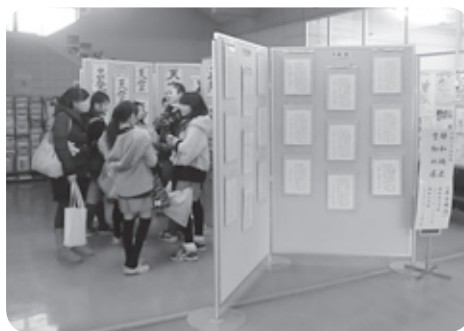
小学生による書初め

毎年、地区の小学生に、書初めをしていただき、その作品を公民館ロビーに展示いたしました。すばらしい作品ありがとうございました。