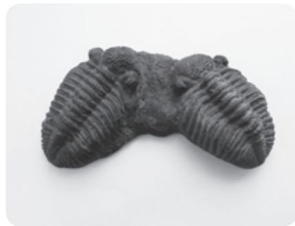
サンヨウチョウのレプリカ作ったよ