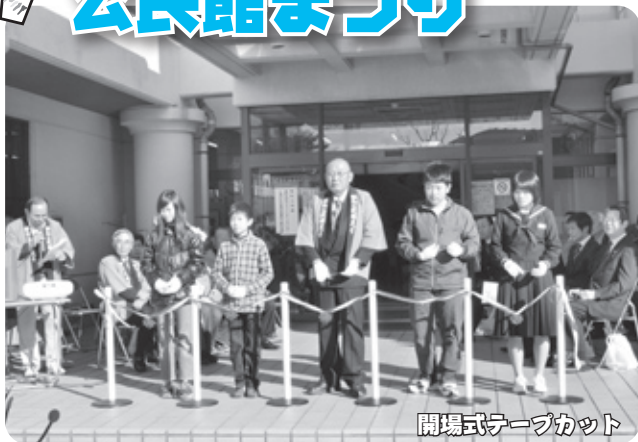
開場式テープカット