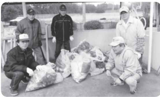
高速道路付近にたくさんのゴミが...

ムや、ディスプレイセンターに展示して、多くの方の目に触れるようにしました。ポスターを通じ、環境への理解が深まることを期待しております。