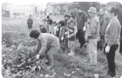
イモの収穫・育っているかな？