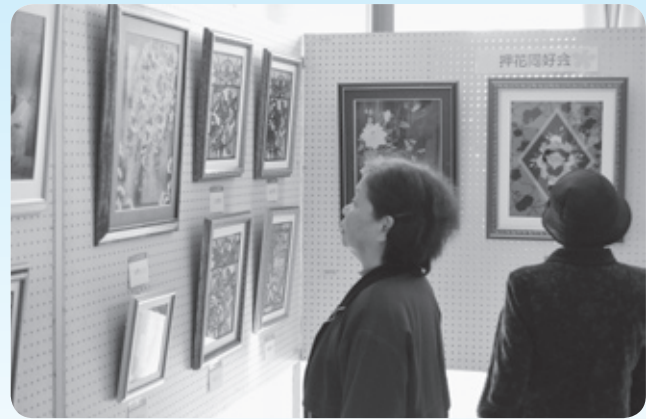
同好会の作品展示