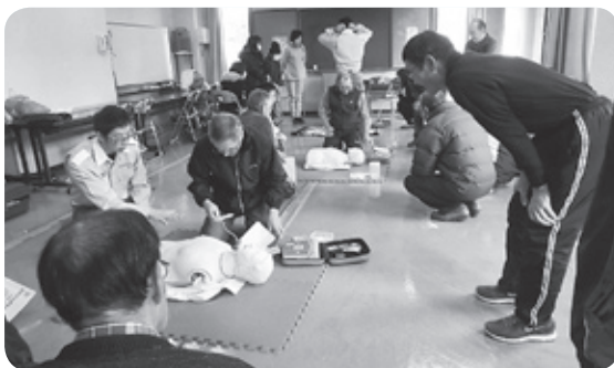
普通救急手当（AED）を学びました

解らない巨大地震に自分の安全をいかに守るかです。安全部では、3月17日都和公民館で「巨大地震が起きたらどう対処するか」のセミナーを開催いたしますので、是非ご参加されることをお願いいたします。