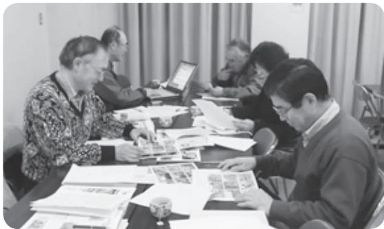
和気あいの広報紙づくり

メインの活動として、「つわの風」の編集・発行を行っており、今回で第22号となります。地域の皆様にご理解いただきます。都和地区市民委員会専門部、体育協会の活動状況、公民館まつり、チャレンジクラブ、まちの話題等を