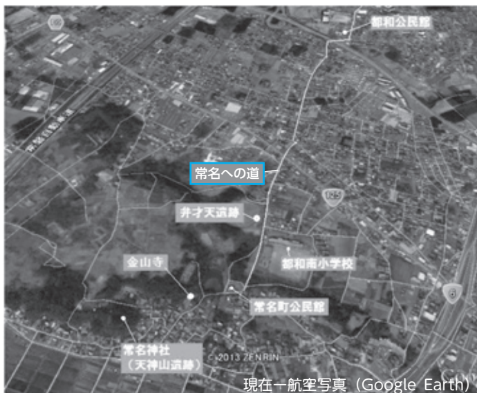
現在一航空写真