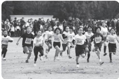
土浦マラソン大会スタート