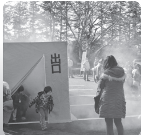
煙も体験しました