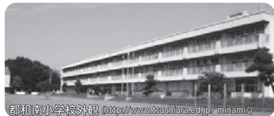
都和南小学校外観 ( http://www.tsuchiura.ed.jp/~minami/ )