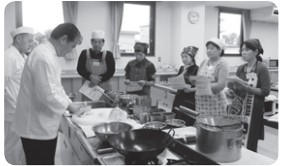
一流ホテルシェフがこっそり教えるおいしい料理