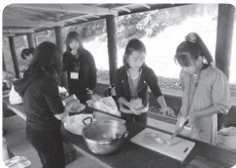
うまくできたかな？

秋晴れの良い天気恵まれ、みんなと力を合わせて一生けん命にカレーを作りました。みんなで作ったカレーは、いつもよりおいしく感じました。