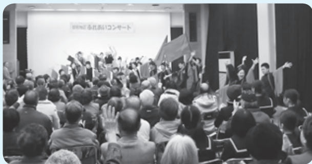
三味線・舞踊・和太鼓多彩