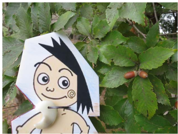
2014/10/15撮影 広場南 コナラの木の下にはたくさんの実が落ちています。大きさがさまざまです。