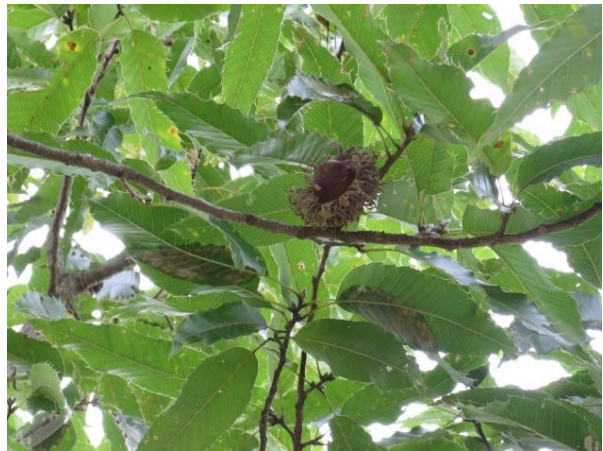
2014/10/12撮影 掘立柱建物のそばにクヌギがあります。 大きなドングリです。