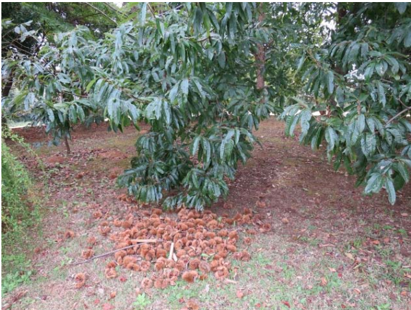
2014/10/12撮影 掘立柱建物付近 クリの収穫は終わりました。クリの実は 縄文時代の重要な食料の一つです。