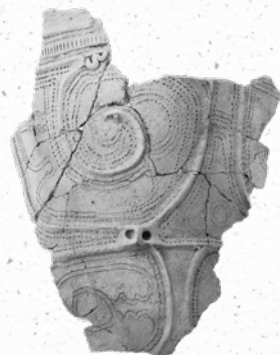
縄文土器 深鉢 (縄文時代中期 神立遺跡出土)

②展示案内会 とき／3月29日(日)、4月26日(日) 午後2時～2時30分 ところ／考古資料館 特別展示室 ※①・②とも事前の参加申込は不要、入館料は必要です。