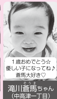
1歳おめでとう☆ 優しい子になってね♪ 蒼馬大好き♡