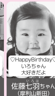
♡Happy Birthday♡ いろいろちゃん 大好きだよ