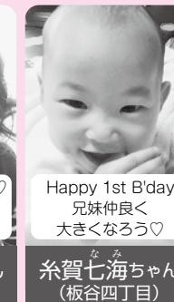
Happy 1st B'day 兄妹仲良く 大きくなる♡