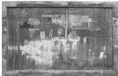
色川三中奉納 醤油醸造絵馬 (笠間稲荷神社所蔵)