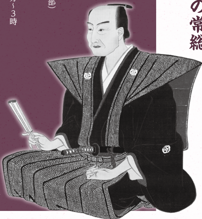
色川三中肖像

とき／3月22日(日)、4月18日(土)、5月3日(日) 午後2時～3時 ※予約不要、入館料が必要です。