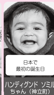
日本で 最初の誕生日