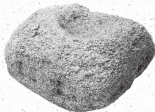
ほうきょういんとう 宝篋印塔の基礎 (中世 下高津小学校遺跡出土)