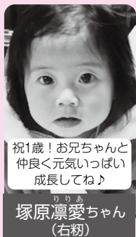
祝1歳!お兄ちゃんと 仲良く元気いっぱい 成長してね♪