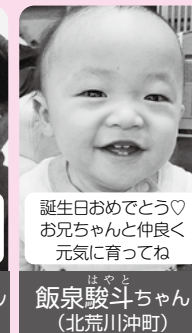
誕生日おめでとう♡ お兄ちゃんと仲良く 元気に育ってね