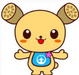
土浦市イメージキャラクター つちまる