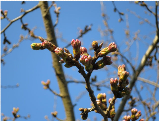
2015年3月26日撮影 広場 ソメイヨシノ 東京が満開のころ、まだつぼみでした。