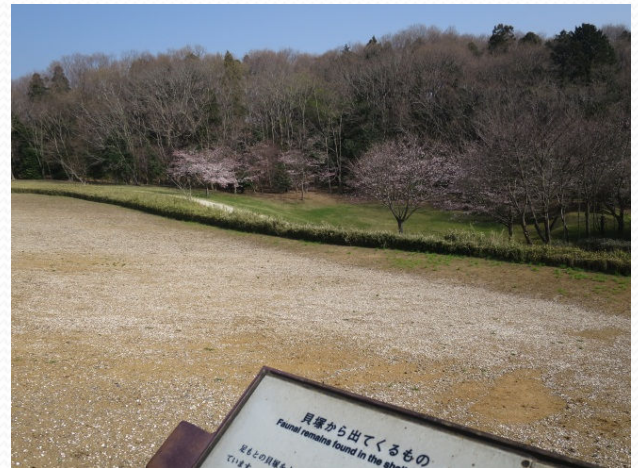
2015年3月31日撮影 広場 ソメイヨシノと貝塚貝層 手前の白いものは貝殻です。