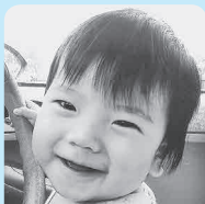
やんちゃんな伶ちゃん 優しいあんちゃんと ずっと仲良くね