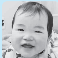
重伸♪おめでとう うまれてきてくれて ありがとう