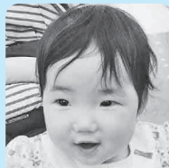
1歳おめでとう(^-^) 元気がいっぱい 大きくなってね♡