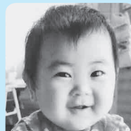
1歳おめでとう ニコニコ笑顔で明るく 元気に育ってね!