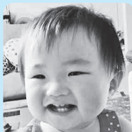
1歳おめでとう♡ 毎日元気に育って くれてありがとう☆