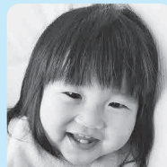
1歳おめでとう幸せ いっぱいありがとう ♡さっ大好き♡