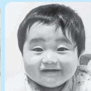
我が家のスマイル王子☆ 笑顔で 皆の♡を虜にしてね!