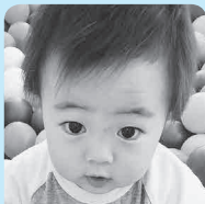
1歳おめでとう! これからも皆に沢山の 笑顔を見せてね