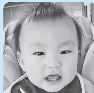
1歳おめでとう☆ これからも元気に 健やかに育ってね!