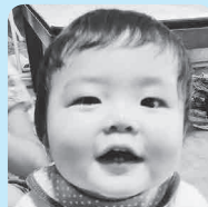
好奇心旺盛な 貴ちゃんこれからも ニコニコこれだね!