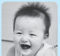
そうちゃんお誕生日おめでとう! ナイススマイルです☆

※11月上・中旬号に分けての掲載。応募写真は返却できませんので、ご了承ください。