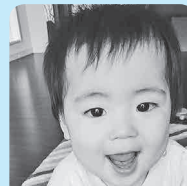
産まれてきてくれて ありがとう♡ 元気に大きくなってね