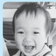
たっくーん♡ 毎日君の笑顔に癒されてるよ!