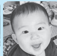
壮一郎兄ちゃんと元気に仲良く大きくなってね☆