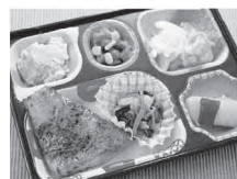
※お弁当の一例です