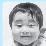
我が家のスマイル王子☆ 笑顔で皆の♡を虜にしてね!