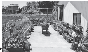
笠師町子ども会育成会花壇▶

※土浦市まちづくり市民会議では、毎年6月上旬に花いっぱい運動コンクールの参加団体を募集しています。