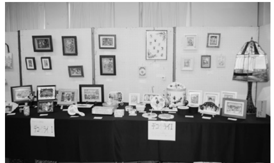
力作ぞろい デコパージュ