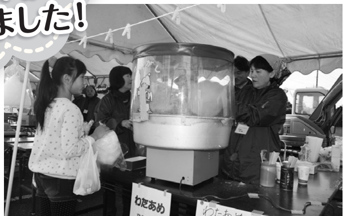
長蛇の列でいつも人気ね