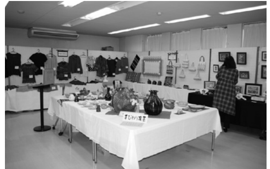
同好会の作品並ぶ 手ひねり陶芸・手編み・刺繍