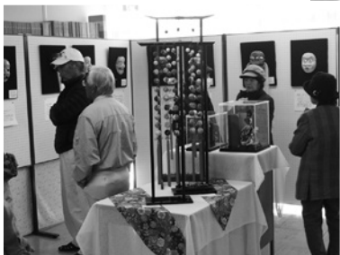
面打ち・古布飾り