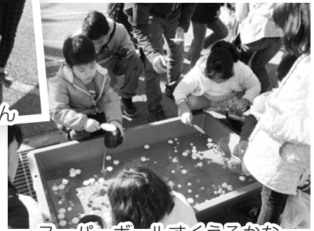
スーパーボールすくえるかな