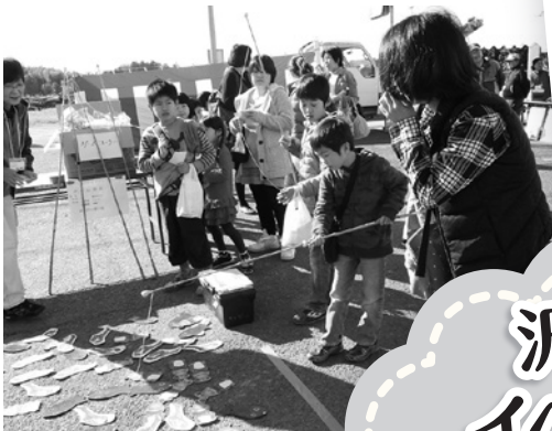
上手に魚つれるかな