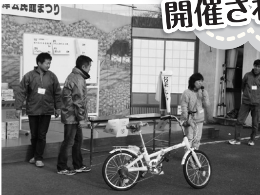
みごとに自転車ゲット(お楽しみ抽選会)