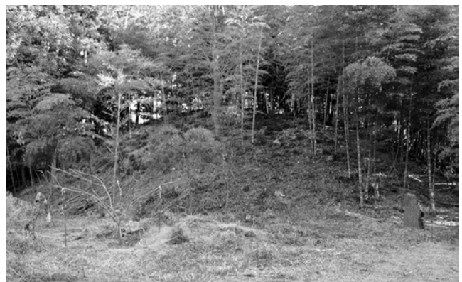
王塚古墳の後円部(北から)