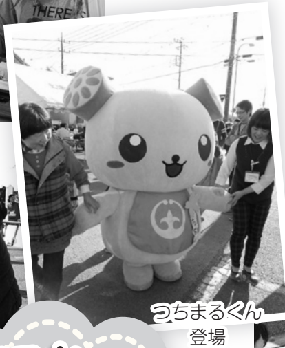
うちまるくん 登場