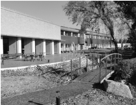
センター棟と南庭

ための調査研究・環境学習・市民活動との連携支援・情報交流に取り組む総合的な拠点施設です。 同年6月には、天皇、皇后両陛下がご視察にいらつしやいました。