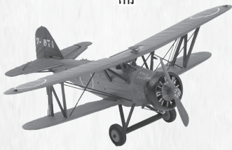
▲練習機赤とんぼ模型