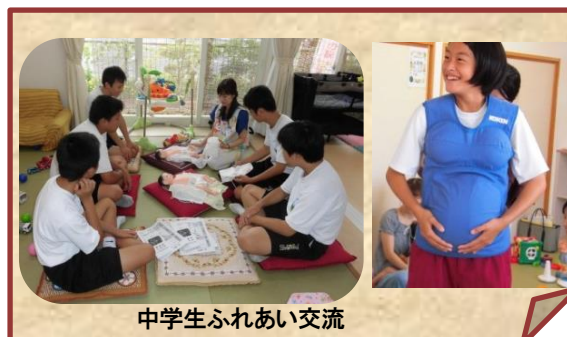
中学生ふれあい交流