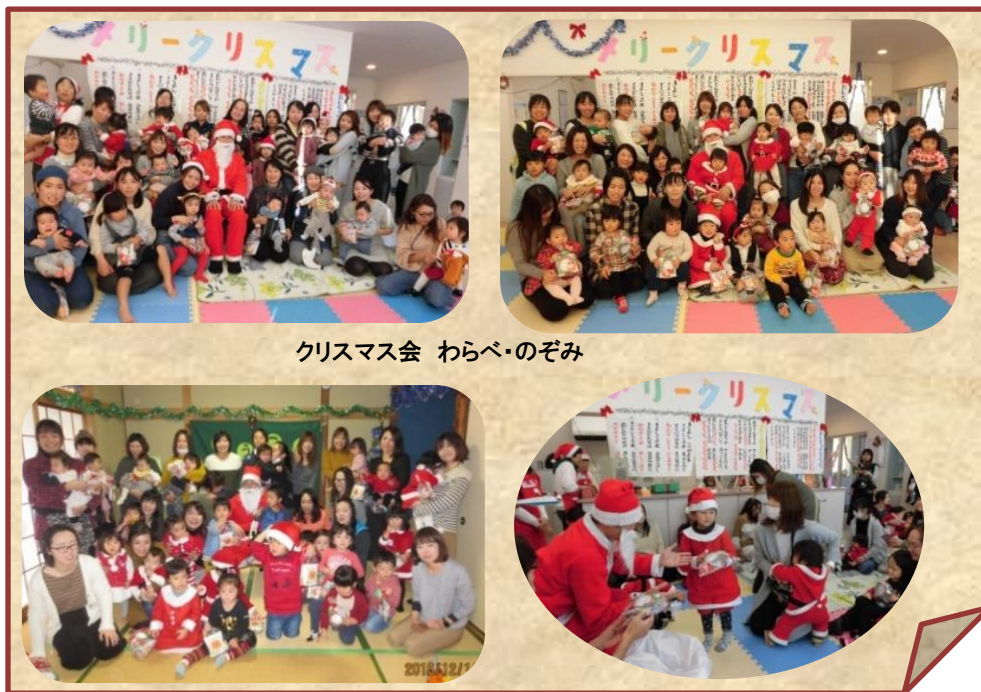
クリスマス会 わらべ・のぞみ