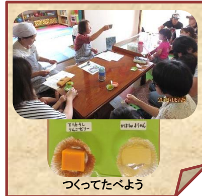
つくってたべよう