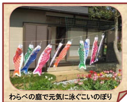
わらべの庭で元気に泳ぐいのぼり