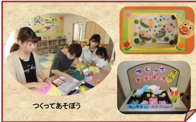
つくってあそぼう