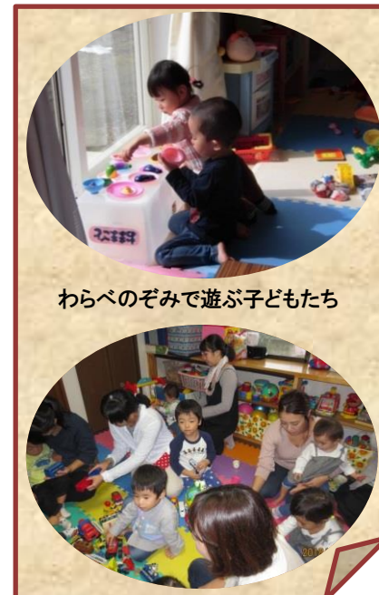
わらべのぞみで遊ぶ子どもたち