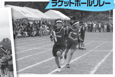
ラケットボールリレー