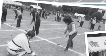
グラウンドゴルフ競争