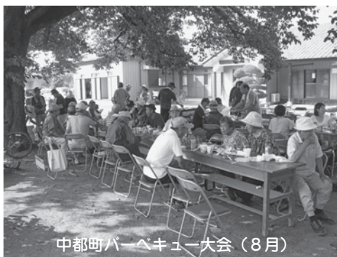
中都町バーベキュー大会（8月）

会」を通じて、老若男女を問わず町内の絆を強め、支えあい、助け合うことを目的として、平成26年8月に結成されました。 スローガンは、「笑顔で無理せず ゆったりと」です。今後は、将棋・囲碁・オセロ、趣味講座等を取り入れて参加者を増やし、さらに充実したサロンにしていきたいと考えております。