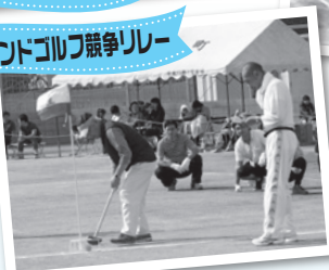
グラウンドゴルフ競争リレー