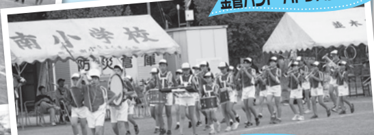
金管バンド・パトパレード