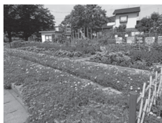
東並木町健康クラブ