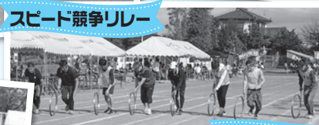
スピード競争リレー