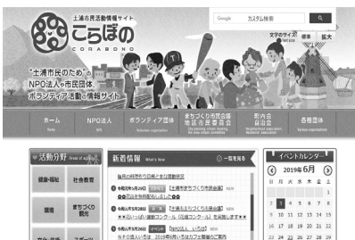
▲こらぼのホームページ