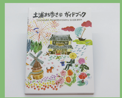
▲ふるやまさんがイラストを担当した「土浦まち歩き学ガイドブック」

【経歴】 筑波大学芸術専門学群卒業。学生時代に土浦まち歩き学ガイドブックの表紙イラストを制作。 近年は土浦市にアトリエを持つ劇団百景社の広報デザインを手がける。