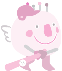
会場 J: COM スタジアム土浦