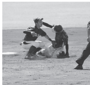
巧みな戦術 スリリングな展開