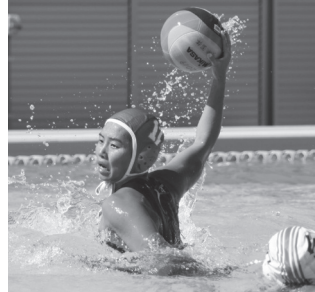
飛び散る水飛沫 水上の格闘技