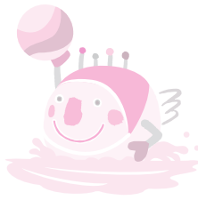
会場 土浦第二高等学校