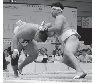
白熱のぶつかり合い 手に汗握る駆け引き