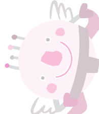
会場 霞ヶ浦文化体育会館