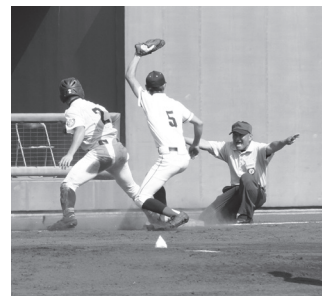
最後まであきらめない ひたむきなプレー