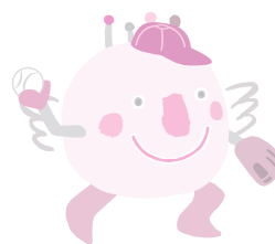
会場 J: COM スタジアム土浦