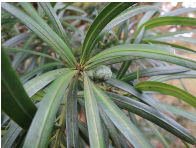
イヌマキ 令和元年11月3日撮影 広場 団子状の実がついています。先端部の丸い緑色のものが実です。