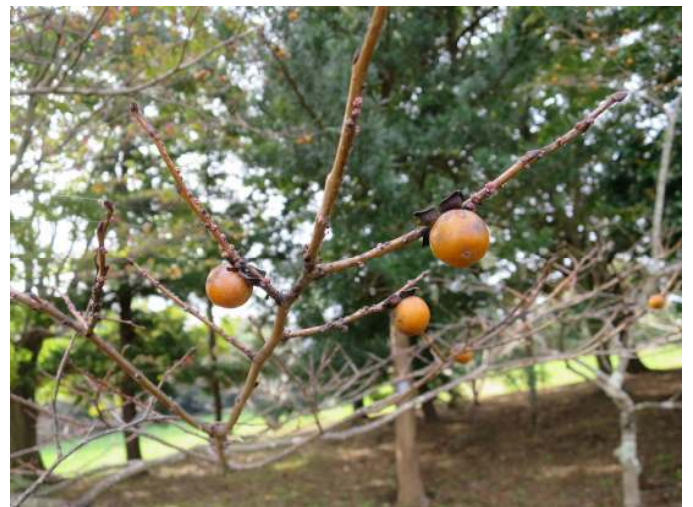
マメガキ 令和元年11月3日撮影 渋くて食べられません。