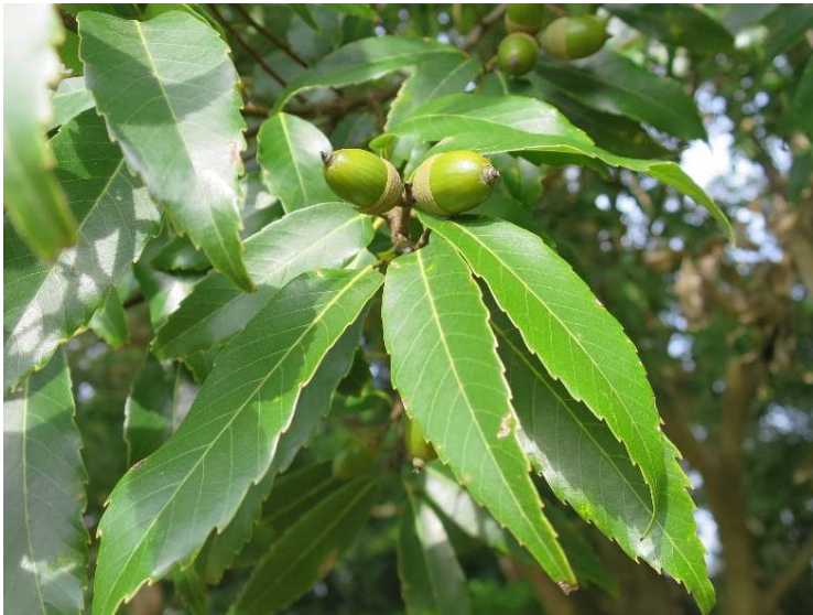
シラカシ 令和元年11月3日撮影 枝についているどんぐりはまだ緑色ですが、根元にたくさんの茶色のどんぐりが落ちています。