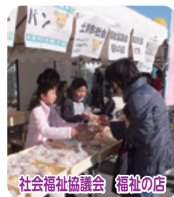
社会福祉協議会 福祉の店