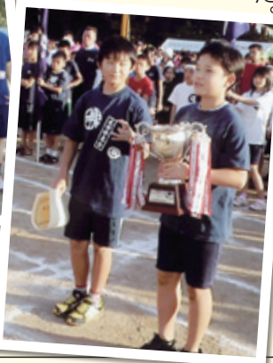
小学生リレー(連覇継続中)

好天に恵まれた中、各種得点種目 に一喜一憂しながら応援しました。 中でも「ムカデ競走」で転倒し最下位 になった時は優勝は無理かと思いま したが、最後の「年齢別リレー」で二 位となり逆転で念願の初優勝が出来 ました。