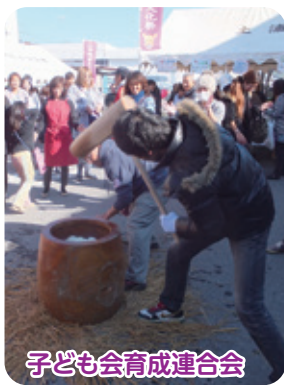
子ども会育成連合会