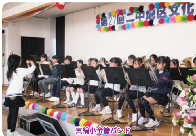
真鍋小金管バンド