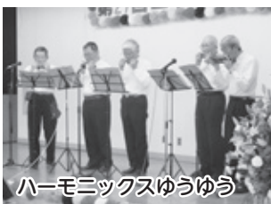
ハーモニクスゆうゆう