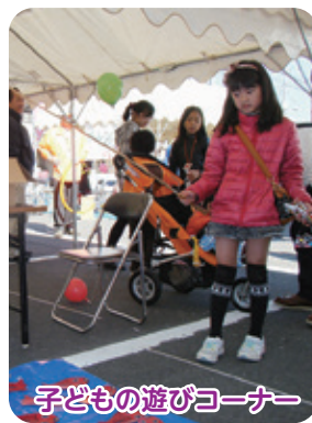
子どもの遊びコーナー