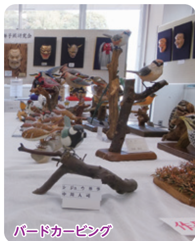
バードカービング