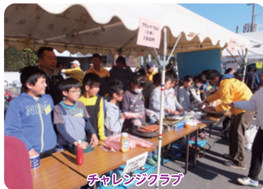
チャレンジクラブ