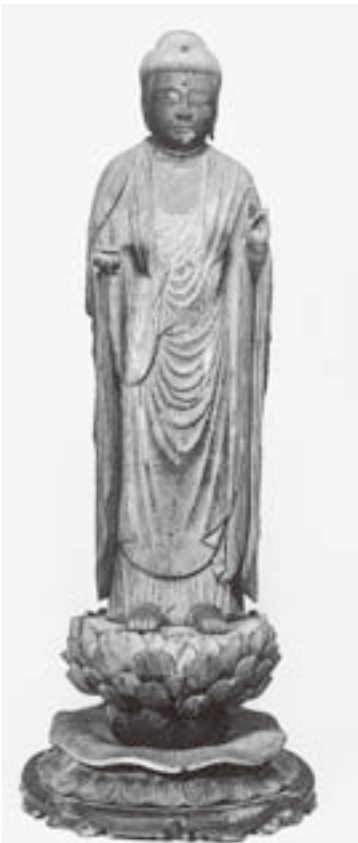
▲木造薬師如来立像(観音寺) 台は、ハスの花の形をしています。

とき／8月3日(日)、16日(土) 午後2時から ※事前申し込み不要。ただし、入館料が必要となります。