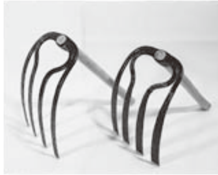
▲レンコン掘り用万能 レンコンを掘るときに使った道具です。

土浦は現在全国有数のレンコン生産地で、栽培にともなうハス田の風景は、霞ヶ浦沿岸の特色ある景観をつくりだしています。また、ハスは古く大陸から渡来し、特に仏教美術がハスの意匠により彩られてきたことはよく知られています。