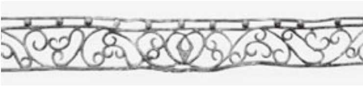
▲銀で出来た帯状の金具 冠あるいは刀の飾りと言われています。

武者塚古墳では、「みずら」と呼ばれる1300年以上前の髪の毛がなぜ見つかったのか？銀で飾った刀はどのようにして手にいれたのか？そんな武者塚古墳にまつわるいくつかの“なぞ”に迫ります。 とき／8月9日(土) 午後2時から ※事前申し込み不要。ただし、入館料が必要になります。