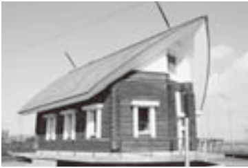
▲武者塚古墳展示施設覆屋