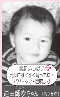
追田師吹ちゃん (桜ヶ丘町)