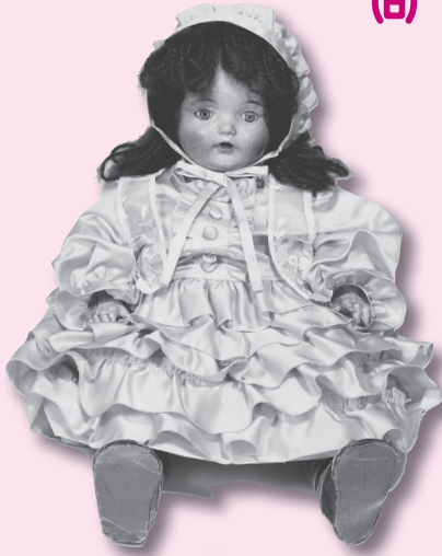
▶土浦幼稚園の「青い目の人形」