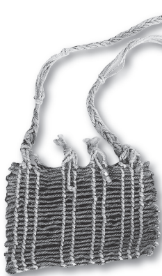
◀講座で作る「編布のポシェット」