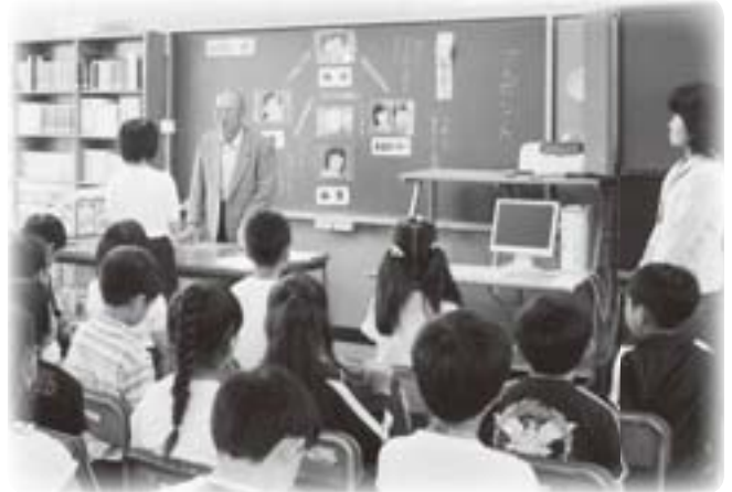
市内の小学校で、市の人権擁護委員による「人権教室」を行っています。

しかし、現実には、この権利を「勝手」や「気まま」とはきちがえ、他人のいうことは少しも聞かずに自分だけの意見を主張したり、勝手な行動をとる人がいるため、ほかの人の人権が侵される事件が起きています。