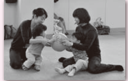
ボールをみんなで仲良くまわしました