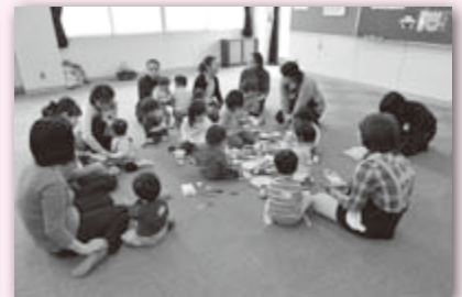
最後は、たくさんのおもちゃで遊びました