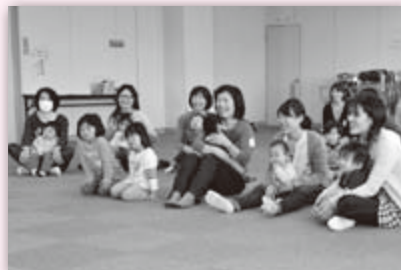
先生の出すクイズにみんな釘付け