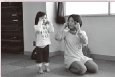
お母さんと一緒に手遊び