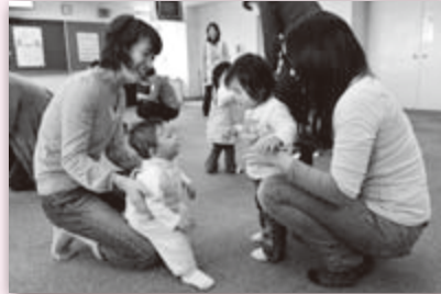
“自己紹介ごっこ”お友達はできたかな