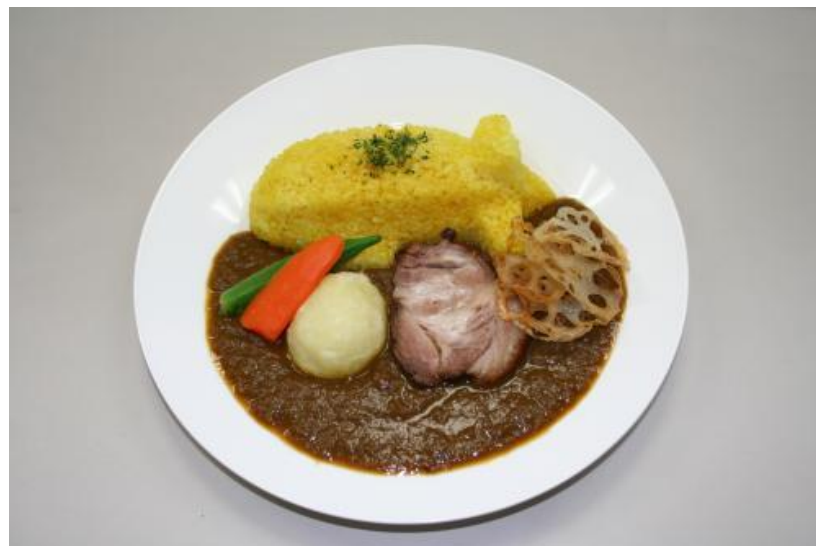
ツェッペリンカレー