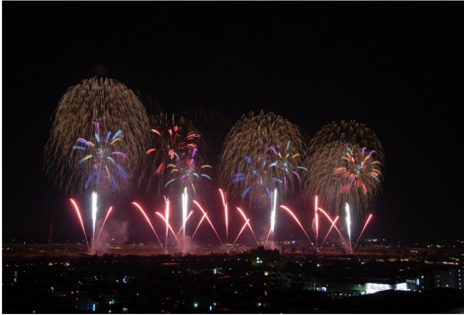
日本一の全国花火競技大会（花火づくし）