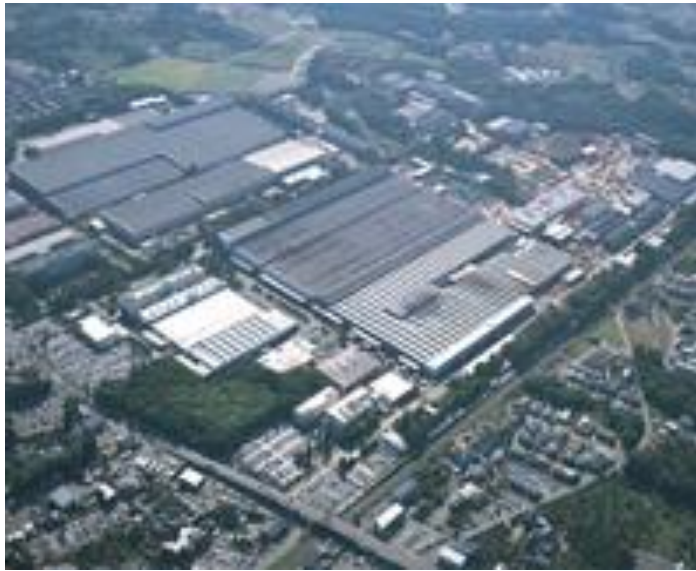
土浦・千代田工業団地（神立地区）