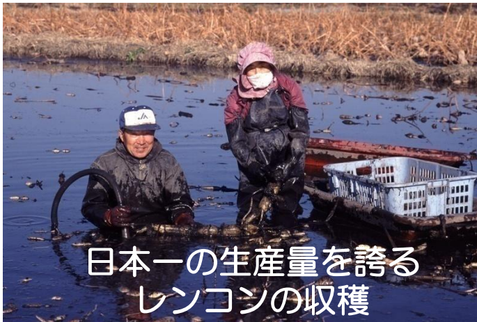
日本一の生産量を誇る レンコンの収穫