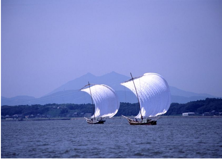
霞ヶ浦（帆曳船）から筑波山麓