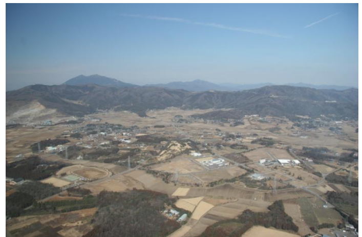
東筑波新治工業団地（新治地区）