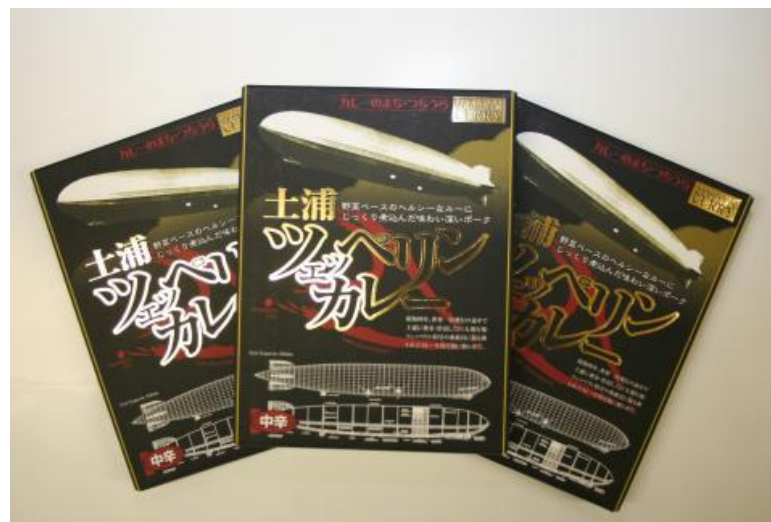
ツェッペリンカレー (レトルト)