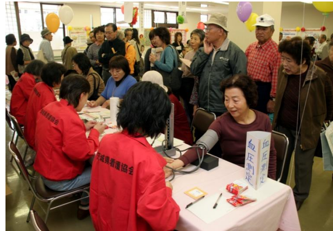
充実した医療・福祉施設