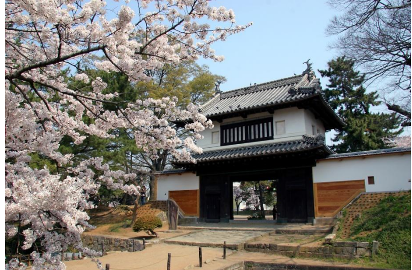
亀城公園（土浦城跡）