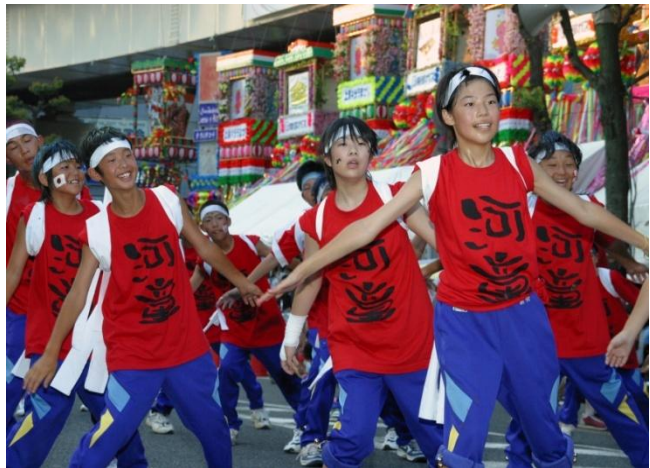
土浦キララまつり