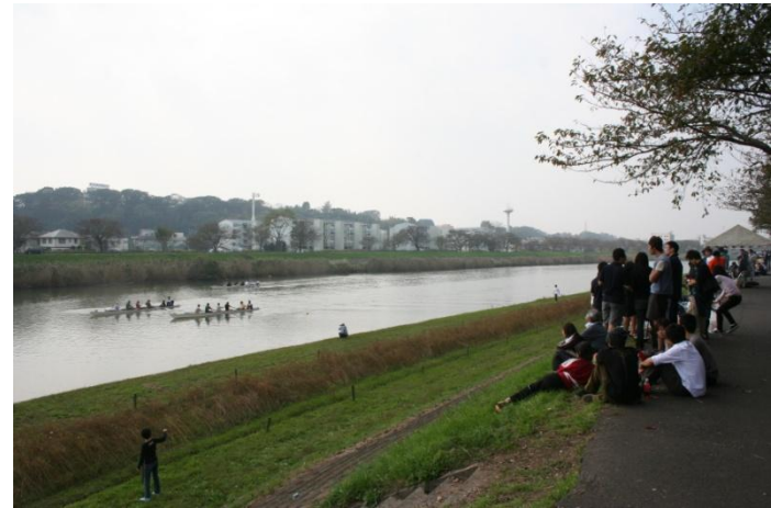
つりが盛んな大小の河川