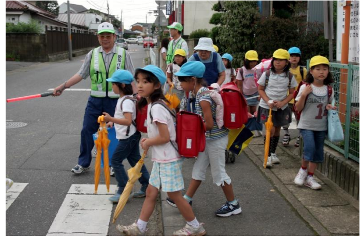
自主防犯組織の活動