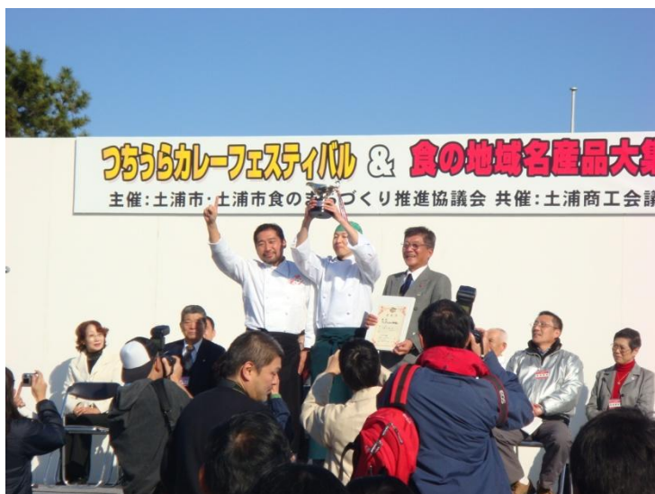
カレーフェスティバル