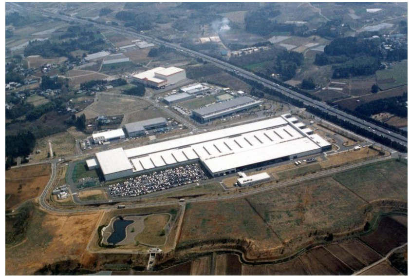
テクノパーク土浦北工業団地（紫ヶ丘）