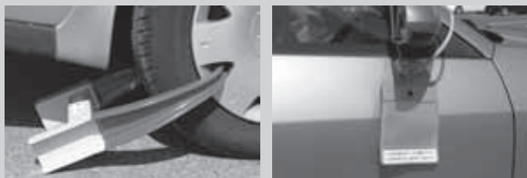
タイヤロック処分例