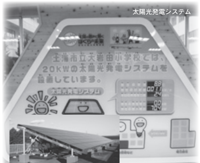
太陽光発電システム

て、「市役所環境保全率先実行計画」を策定します。「低炭素社会」の実現につきましては、本年度、国からの交付金を活用し、霞ヶ浦総合公園の園路灯のLED照明器具への交換を前倒して実施し、新年度は新治総合福祉センターに太陽熱温水器を設置するなど、省エネ効果による環境負荷の軽減を図ってまいります。