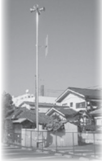
同報系防災行政無線

化を図ります。特に、新年度は、神立菅谷都市下水路の早期整備を目指すとともに、木田余第一排水区雨水排水路の重点的な整備を図ります。