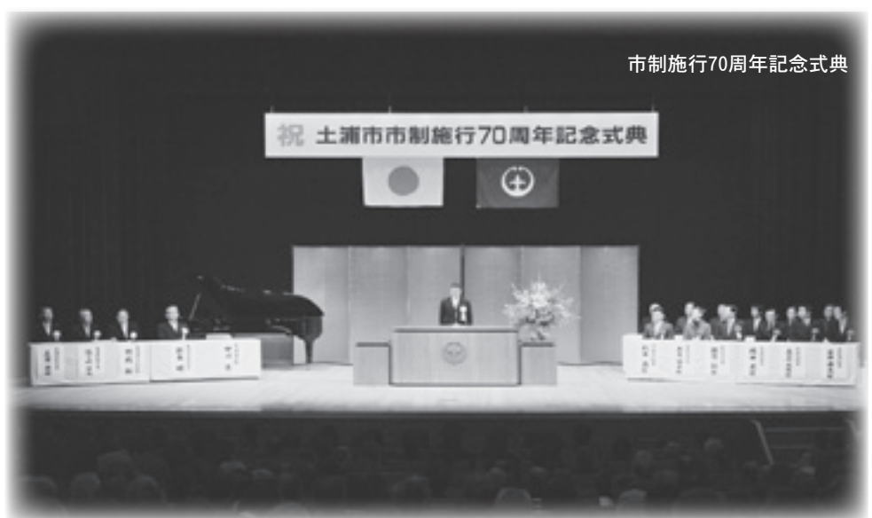
市制施行70周年記念式典

は、本年度策定いたします「第4次行財政改革大綱」を踏まえ、「木を見て森も見る」、分野横断的な視点に立った総合的な展開を図ってまいります。