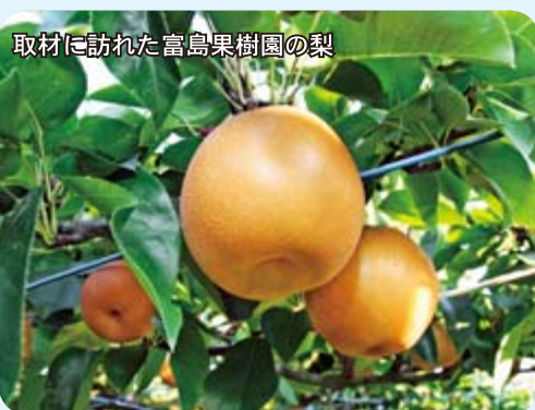
取材に訪れた富島果樹園の梨