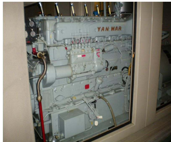
機械設備（エンジン）