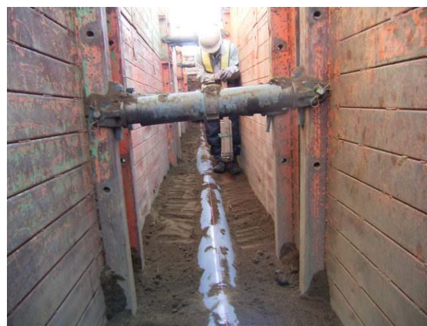
並木第一処理区分公共下水道（污水）工事