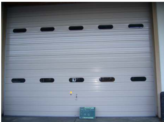
オーバーヘッドドア改修工事