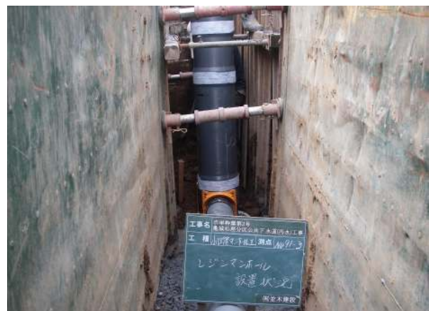
亀城処理分区公共下水道（污水）工事