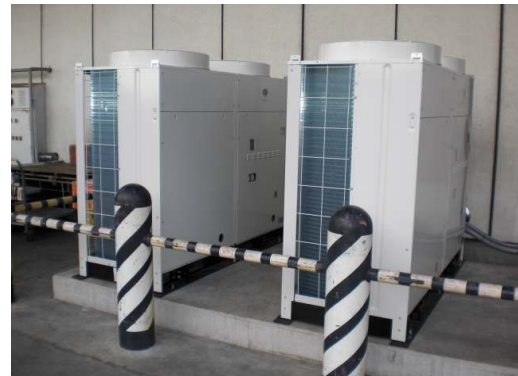
青果低温卸売場冷凍機更新工事