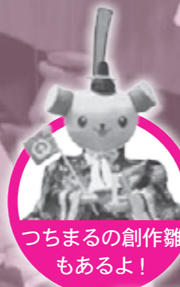
つちまるの創作雛もあるよ!