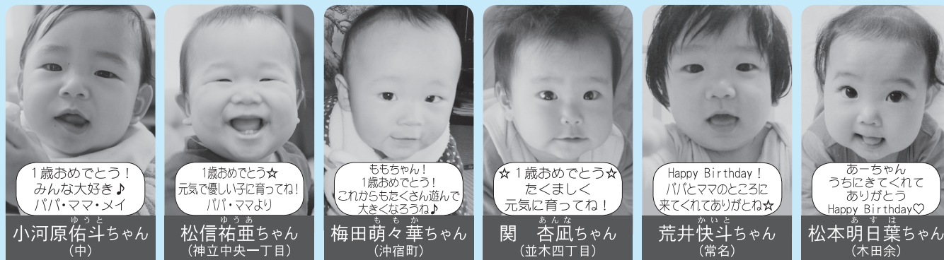
※掲載した氏名、住所などの個人情報は、この広報紙以外では使用しません。