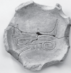
赤弥堂遺跡(土浦市)出土 台形土器

今回の展示では、霞ヶ浦沿岸の地形の成り立ちや、貝塚から出土する貝や魚の骨などの資料から縄文時代の自然環境を探り、霞ヶ浦沿岸・桜川流域の遺跡の資料から、この地に暮らした縄文人の生活の一端を紹介します。