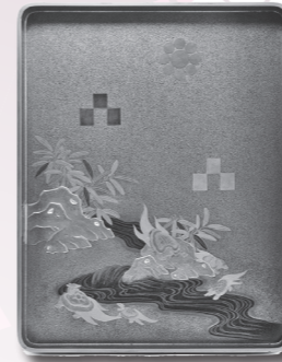
◀ 三石九曜紋入松竹蒔絵料紙箱 (蓋裏)