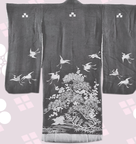
▲ 紺地松竹梅鶴亀文様振袖 (京都国立博物館所蔵) 三石紋入りの産着。子供の誕生に合わせて準備されました。

今年、享保7(1722)年に82歳でなくなった政直の没後290年にあたります。区切りの年に、土浦藩の基礎を築いた政直の姿を紹介します。