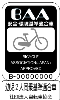
安全基準適合マーク例

補助対象／4月以降に市内の販売店で購入した新品の幼児2人同乗用自転車(安全基準に適合し、防犯登録を受け、幼児用座席が2つ装備されていること)