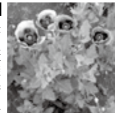
植えてはいけない「けし」が、茎を抱きかかっているのが特徴

けしの仲間には、春から色鮮やかで美しい花を咲かせ、觀賞用として人気があります。しかし、その中には、法律で栽培が禁止されているものもあります。 植えてはいけない「けし」を発見したときは、土浦保健所までご連絡ください。