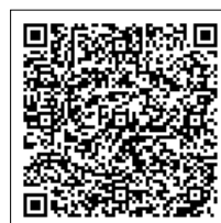
がんBAR土浦ホームページ

問 土浦商工会議所(☎822-0391)、商工観光課(☎826-1111 内線7602)