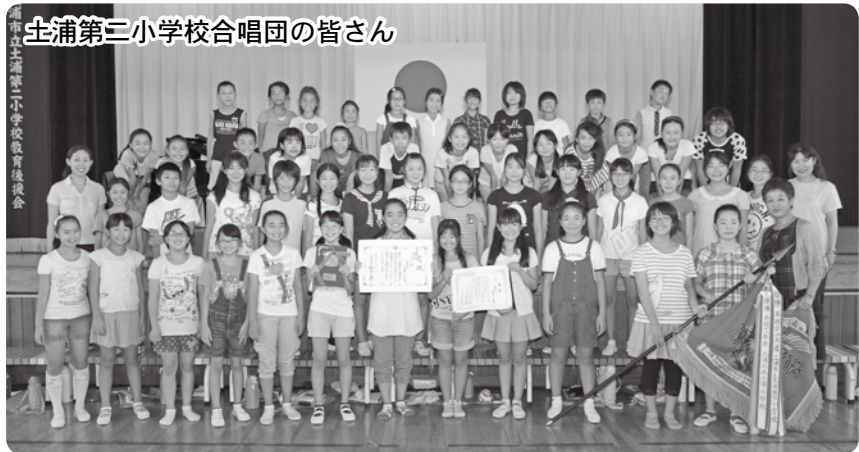
土浦第二小学校合唱団の皆さん

8月2日にひたちなか市文化会館で行われた「第79回NHK全国学校音楽コンクール茨城県コンクール」小学校の部で、土浦第二小学校合唱団が2年連続の金賞を受賞しました。同合唱団は、県の代表として9月9日(日)に埼玉県さいたま市、大宮ソニックシティで開催される「NHK関東甲信越ブロックコンクール」に出場します。健闘をお祈りします。 ※土浦第二小学校合唱団は、「TBSこども音楽コンクール茨城県コンクール」でも最優秀賞を受賞し、12月26日(水)に江戸川区総合文化センターで開催される「TBSこども音楽コンクール東日本大会」にも出場します。