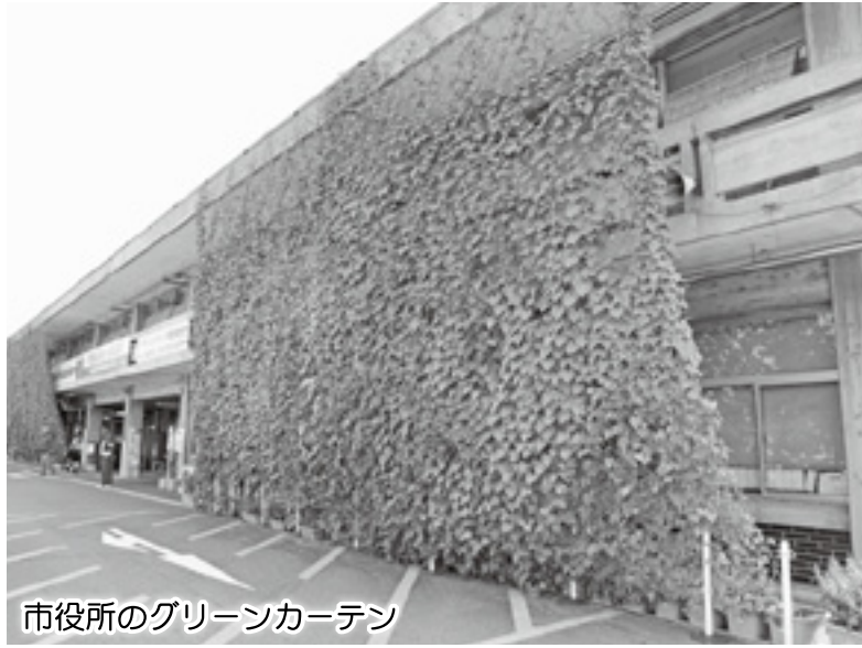
市役所のグリーンカーテン

低炭素社会の実現につきましては、これまで取り組んできた省電王コンテスト、環境展の開催な