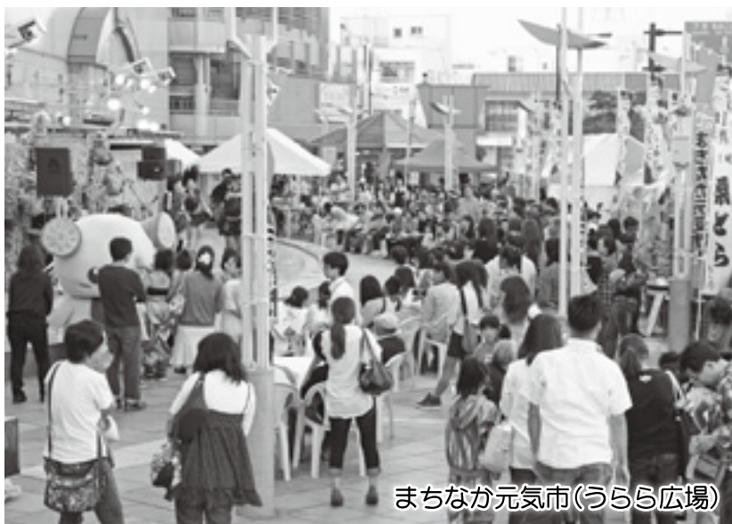
まちなか元気市(うらら広場)

神立駅西口地区につきましては、橋上駅舎や東西自由通路の整備と併せ、土地区画整理事業により駅前になぎわいあるまちづくりを促進します。都市景観の整備につきましては、歴史的建造物などの修景助成制度の利用促進を図るとともに、真鍋地区の景観まちづくり調査を実施します。