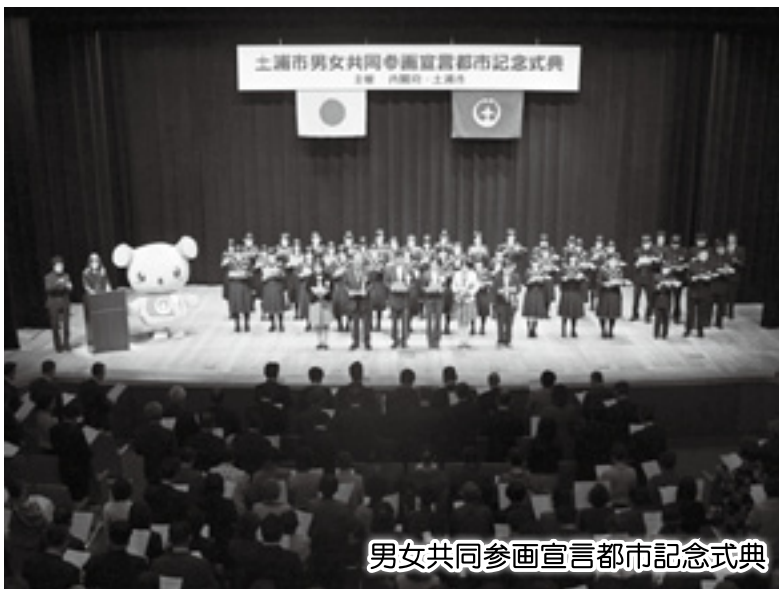
男女共同参画宣言都市記念式典

市民懇談会については、未来を担う若い世代を対象に開催し、市民と行政が共に考え行動するま