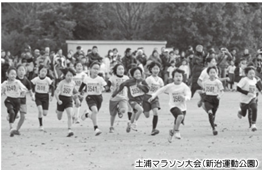
土浦マラソン大会(新治運動公園)

水郷プールについては、既存施設を解体撤去し、新設に伴う基本および実施設計を行います。