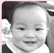
1歳おめでと♡毎日ニコニコ元氣に大きくなるうね!