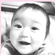
生まれてきてくれてありがとう☆