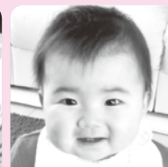
笑顔の似合う素敵な女の子になってネ両親・ににより