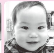
1歳おめでと♡元氣にたくましく育ててネ