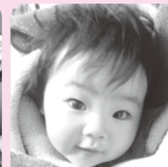
おめでと♡トロロに会ったら教えてネ!!めい大好き♡