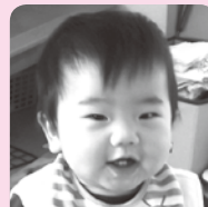
ニコニコ笑顔が最高～素直にのびのび元氣一杯育ててね