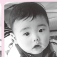
お誕生日おめでと♡元氣いっぱいひのびと育ててね!