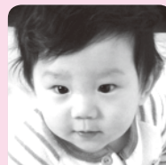
happy birthday 笑顔いっぱいありがとう