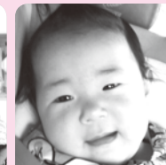
1歳おめでと♡生まれてきてくれてありがとう大好き☆