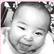
♡1歳おめでと♡ カワイイ笑顔が大好きだよ♡