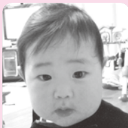
1歳おめでと♡いっぱい笑って元気に育ててね♪