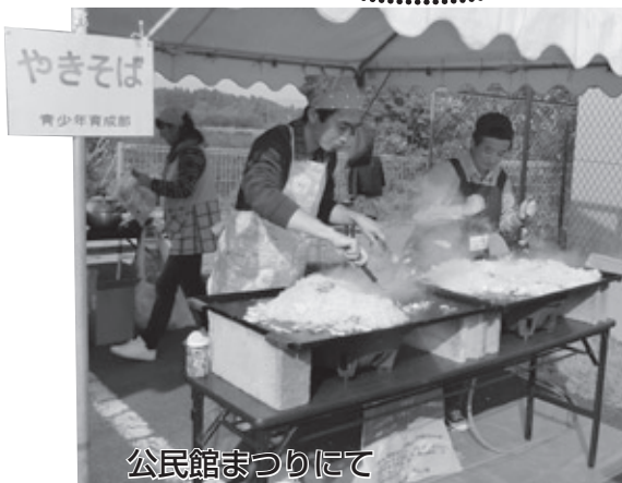
公民館まつりにて