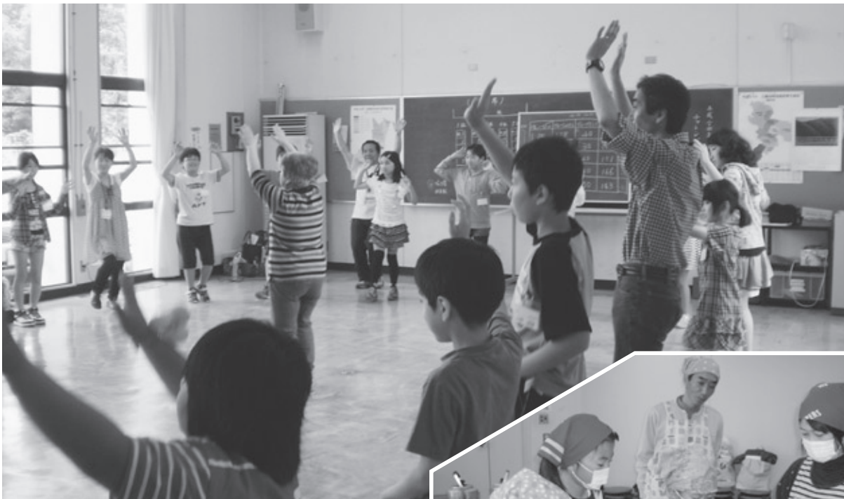
チャレンジクラブ開講式でゲーム