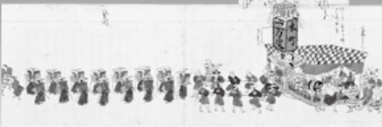
▲▲▼「土浦御祭礼之図」 (土浦市指定文化財、文化9(1812)年の惣町大祭を描いたもの)