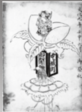
▲「土浦山車図譜」 (個人所蔵、中城町の「桃太郎」の万度)