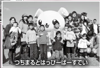
つちまるとはっぴーはーすてい