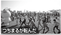
つちまるが転んだ