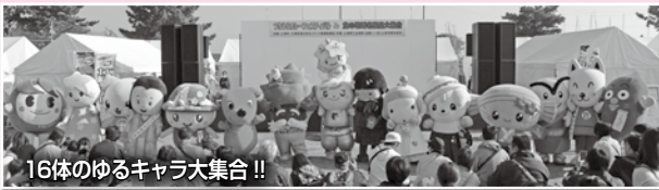
16体のゆるキャラ大集合!!