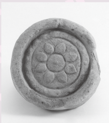
▲軒丸瓦(東城寺跡出土)

ろには、保安3(1122)年、天治元(1124)年の銘がある経筒などが見つかった東城寺経塚群(県指定史跡)もあります。筑波山周辺に築かれた山寺の多くはその後廃絶したところが多いなか、東城寺は1200年もの歳月を越え、今日まで法灯を伝える点でも特筆されます。春ともなれば緑美しい古刹・東城寺を訪ね、古代の息吹を感じてみてはいかがでしょうか。