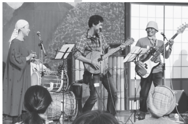
ノリノリ♪ アフリカの太鼓演奏♪