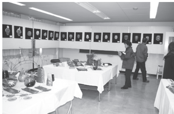
力作ぞろいの作品展