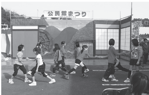
新登場ストリートダンス