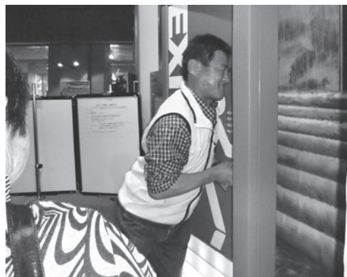
東京消防庁本所都民防災教育センター視察 水圧実験中 (安全・スポーツ健康部)

環境部 巨樹、巨木に学ぶ、 青少年育成部 夏休み子ども映画、 作品展、講演会「こどもの食育」、親子チョコ作り 福祉部 いきいきヘルス体操、 正月行事「ならせ餅」 安全部 防犯講習会、救命講習会 スポーツ健康部 救命講習会、 五中地区歩く会 文化広報部 広報紙66・67号発行、 文化茶話会「今、放射能を学ぼう」 各部頑張っております。