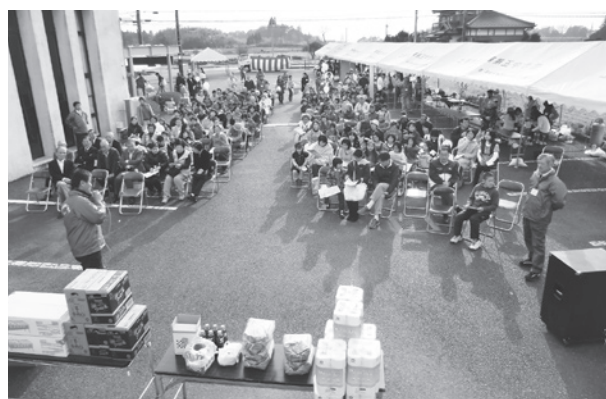
お楽しみ抽選会☆一等はディズニーリゾートペアチケット