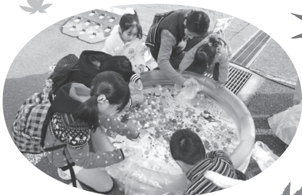
スーパーボール何個取れるかな？