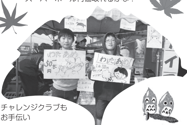
チャレンジクラブも お手合い