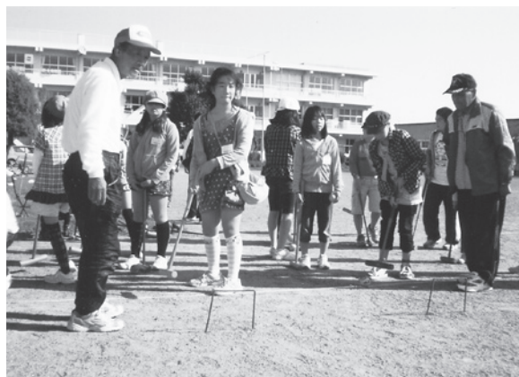
ゲートボールでお年寄りと交流 (10月29日)

チャレンジクラブ 年10回 開講式 6月11日 スタート ゲームと焼そばで友だちになろう 閉講式 3月3日 お別れ会 楽しいひな祭り料理 *今年度は28人の仲間です。