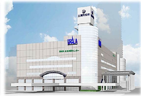
新本庁舎(イメージ)