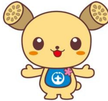
土浦市イメージキャラクター「つちまる」