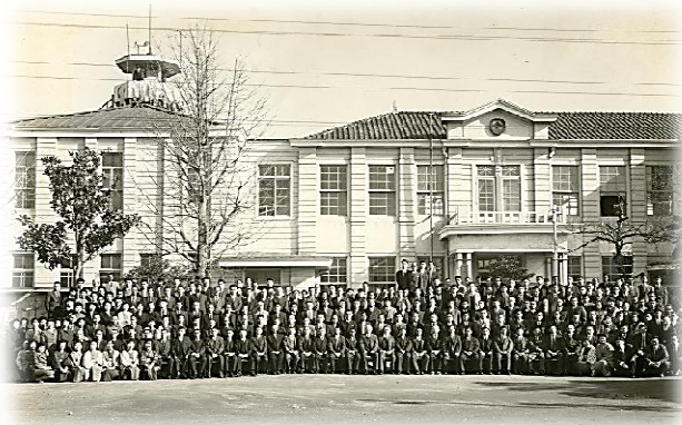
昭和35年当時の本庁舎