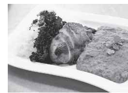
第1回 GP JA 土浦「里の特製レンコンカレー」