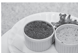
第6・7回創作 レストラン中台「三代目の焼きプリンレンコンのコンポート入り」