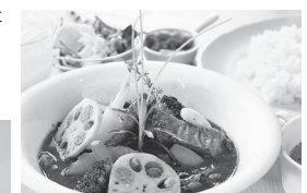
第4回主菜 洋食ざんぎすかんひつじの小屋「土浦ちんぎすスープカレー」