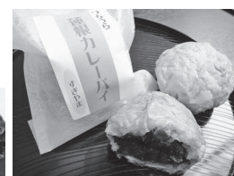
第5回創作 創作和菓子すぎやま「カレーパイ」