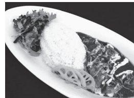
第3回主菜 バスティュー「飯村牛の煮込みカレー」