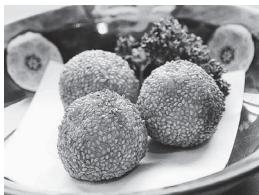
第3回創作 中華料理泰山「カレーボール」