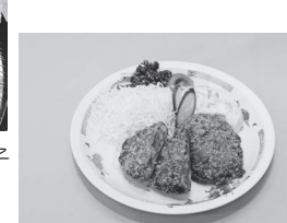
第4回創作 中華の福来軒「福来軒のツェペリンカレーコロッケ」