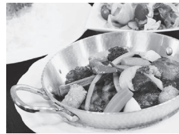
第2回GP 第5・7回主菜 レストラン中台「幻の飯村牛とレンコンのビーフシチューカレー」