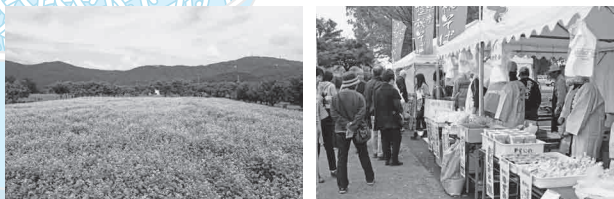
筑波山麓に広がるそば畑(新治地区)

内容 ／手打ちそば販売、そば創作料理販売、ステージイベント(T-Princess、落語など)