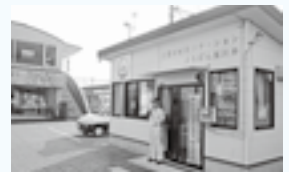
荒川沖東二丁目2番25号