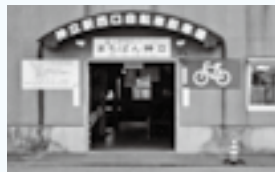
神立中央一丁目1番