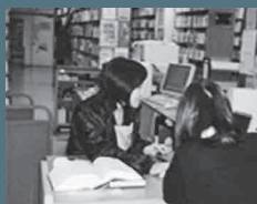
レファレンス(相談)カウンター