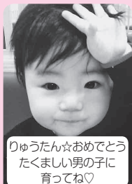
りゅうたん☆おめでとう たくましい男の子に 育ってね♡