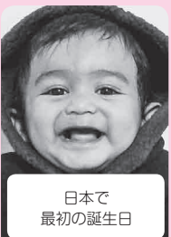
日本で 最初の誕生日