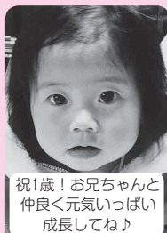
祝1歳!お兄ちゃんと 仲良く元気いっぱい 成長してね♪