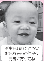
誕生日おめでとう♡ お兄ちゃんと仲良く 元気に育ってね