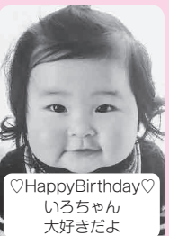
♡Happy Birthday♡ いろいろちゃん 大好きだよ